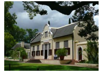
HERRLICHE STÄDTE UND ARCHITEKTUR