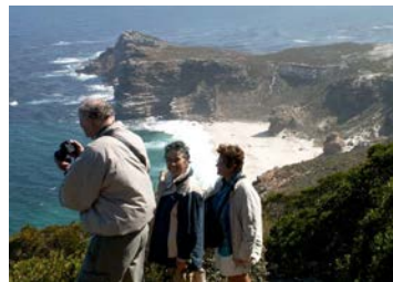
HERRLICHE LANDSCHAFTEN UND STRÄNDE